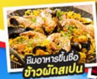
ชิมอาหารขึ้นชื่อ ข้าวพริกสเปน