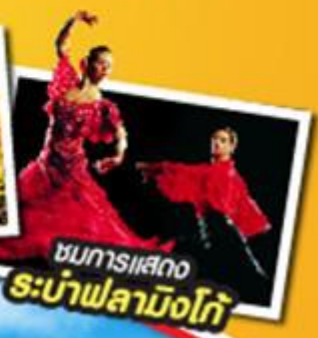
ชมการแสดง ระบำฟลามิงโก