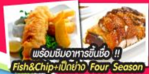
พร้อมชิมอาหารขึ้นชื่อ !! Fish&Chip+เป็กย่าง Four Season