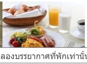
ภาพจำลองบรรยากาศที่พักเท่านั้น

วันที่สี่ อิสระช้อปปิ้งในเมืองโตเกียว ไม่มีรถโค้ชบริการตลอดวัน / เดินทางโดยรถไฟตลอดวัน (ค่ารถไฟไม่รวมในค่าทัวร์) (B/-/-)