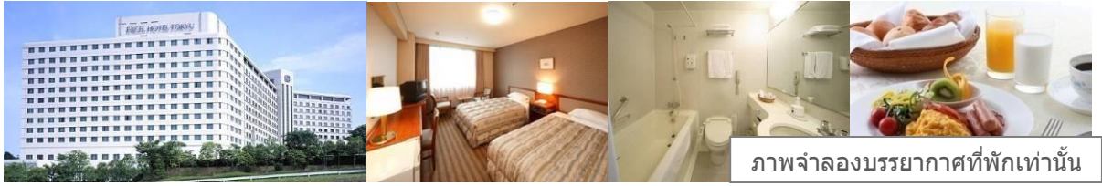
ภาพจำลองบรรยากาศที่พักเท่านั้น

นำท่านเข้าสู่ที่พัก ณ โรงแรม NARITA EXCEL OR SML